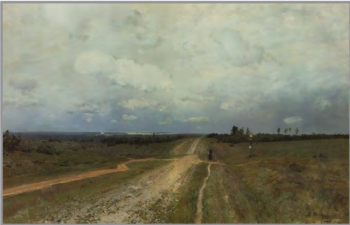
La Vladimirka, par Levitan

la vaine poursuite du soleil. À rebours du pas des forçats et du chemin de zeks. Comme d'émerger de l'horizon, du point de fuite de la Vladimirka. De Vladivostok à Paris puis à Brest : du port extrême de l'Asie sur le Pacifique au port extrême de l'Europe occidentale.